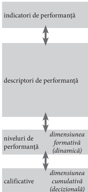
Figura 1. Corelarea dimensiunilor formativă și cumulativă ale aprecierii rezultatelor școlare în contextul ECD

ECD se înscrie în paradigma evaluării formative, de aceea în clasele I-III se acordă prioritate dimensiunii formative a aprecierii rezultatelor școlare – comportamentului performanțial al elevului.